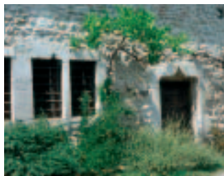
La Dent de Crolles La maison "Beyroud"

facilitent votre ascension. Des ronces vous incitent à faire une petite pause pour déguster quelques mûres , qui sont aussi largement appréciées par la grive musicienne . Mais attention!... Ne ramassez pas les fruits trop bas car le renard roux pourrait avoir uriné dessus et véhiculé ainsi l'échinococcose, une maladie grave pour l'homme.